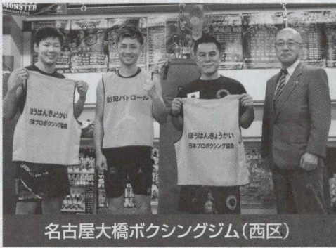
名古屋大橋ボクシングジム(西区)