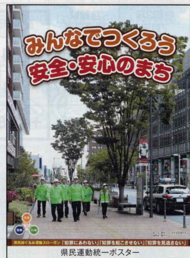
県民運動統一ポスター

この運動は、県民一人一人が防犯意識を高め、県民総ぐるみの安全なまちづくり活動を広く県民運動として推進し、犯罪を起こさせない環境作りに取り組むことにより、安全に安心して暮らせる社会の実現を目指すものです。